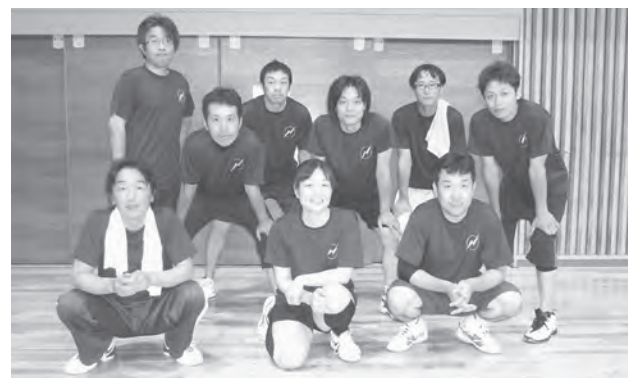
第3位の新津支部青年部