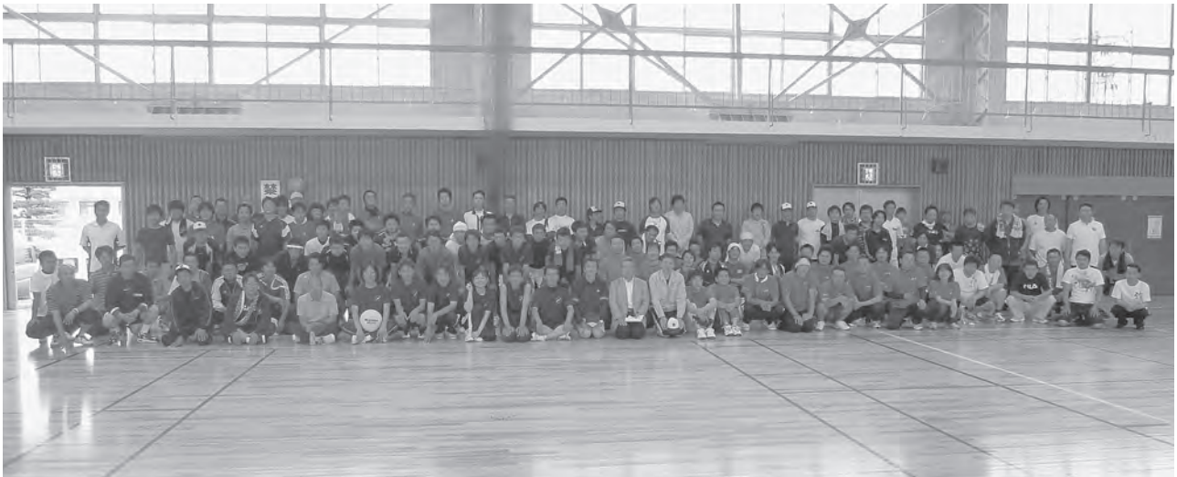
各支部青年部会員129名が柏崎に集結！