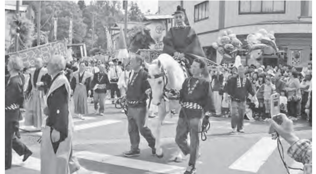
大 行 列

今年は晴天にも恵まれ、180余りの露天商も手伝い、宵宮、本宮ともに大勢の人出で賑わいま