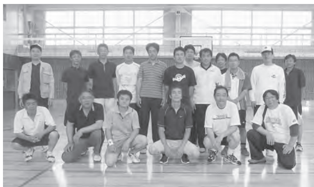
準優勝の柏崎支部青年部

決勝まで勝ち進んだのは、村上・燕支部青年部合同チームと昨年度準優勝の柏崎支部青年部。共に勝てば初優勝となるため、両チームとも気合が入り試合は第3セットまでもつれ込み