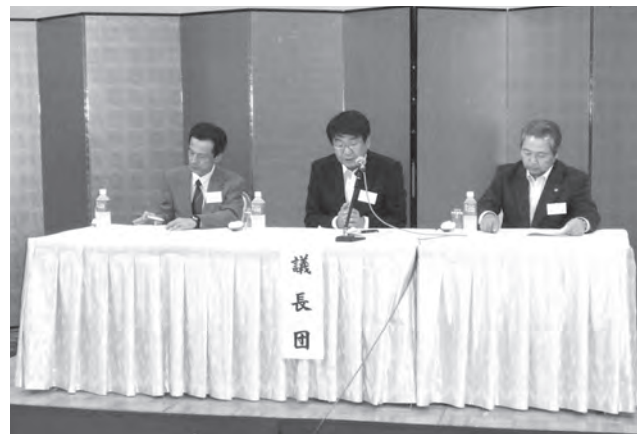
議 長 団

営企画推進委員会関係、技術委員会関係、資材委員会関係、引込線事業委員会関係の各事業委員会関係の主な事業の実施状況について報告が行われた。