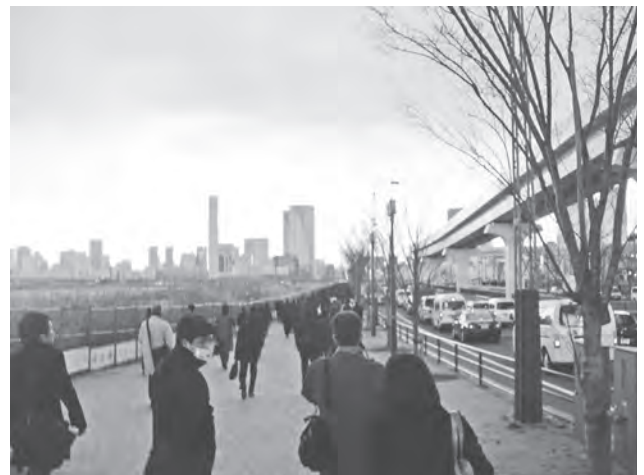
震災直後、徒歩で家路に向かう人々の列

部の地震で目が覚め、新幹線が不通になっていることをテレビで知り、早朝会議を行い、レンタカーを使うか？普通列車で帰るか？など考えましたが、新幹線が復旧するのを待って帰ることにしました。結果、無事に帰ることができ良かったです。最後に、東日本大震災で被災された方々の一日も早い復旧、復興を祈念して、報告を終らせていただきます。