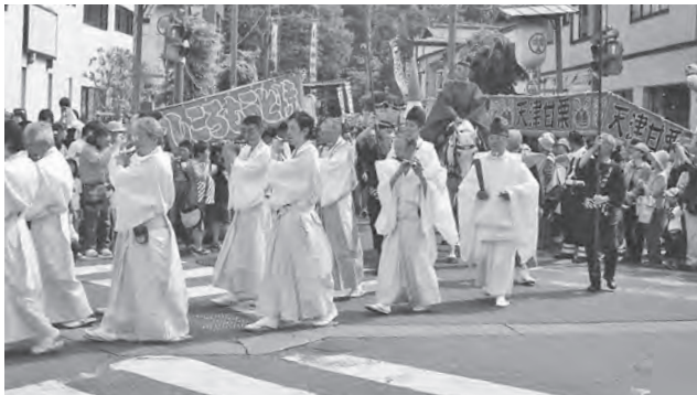
大 行 列

天狗様を始め、大勢の女の子の「お稚児様」、男の子の「お徒士たち」が続き、幼児をおんぶした若い母親たちの「乳母行列」、そして三体のお神輿等々と大行列をなし、加茂の町を練り歩くのです。