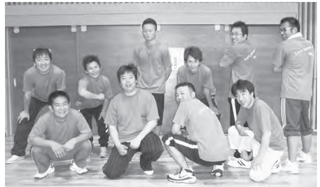
第4位の新潟支部青年部

会員交流会の中で次回開催地は新発田に決定！来年度の新発田大会に向け、各チーム早くも気合が入っていました！