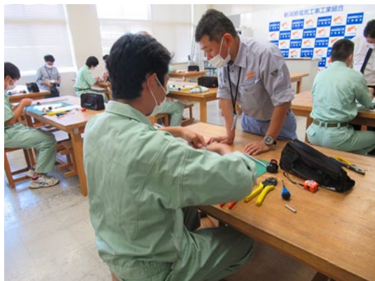
令和3年7月1日（木） 小千谷西高校 総合学科 3年生 12人