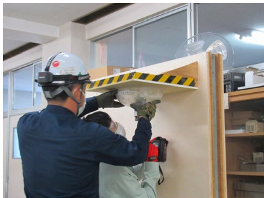
令和3年11月5日（金） 長岡工業高校 電気エネルギーコース 2年生 40人