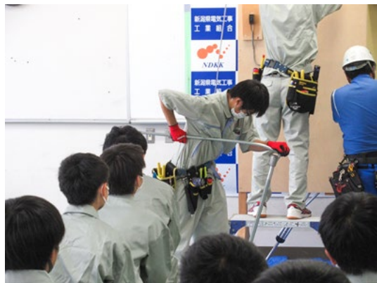
令和3年9月8日（水） 上越総合技術高校 電気エネルギーコース専攻予定者 1年生 39人