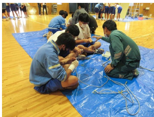
令和3年10月1日(金) 長岡市立江陽中学校 2年生 33人

これまで実施した各校での概要、アンケート結果は、組合員の方は「サイボウズ → ファイル管理 → 高校生との交流事業（出前授業）」