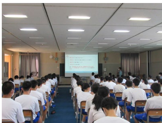
令和3年7月15日(木) 柏崎市立鏡が沖中学校 2年生 80人