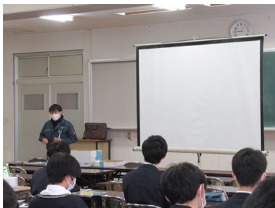
令和4年2月7日(月) 新発田南高校 電子情報工学科 2年生 37人