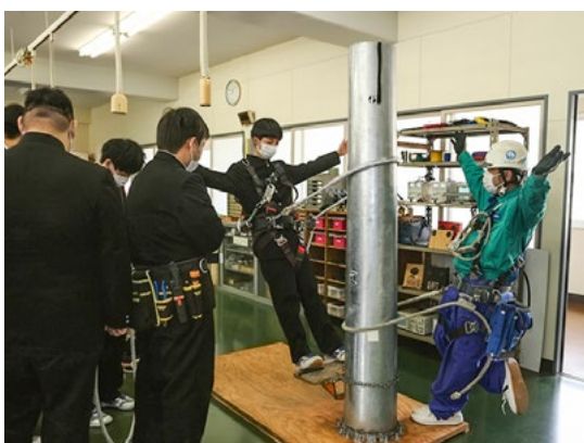
令和4年3月16日(水) 新津工業高校 生産工学科・ロボット工学科・生産マイスター科 2年生 113人