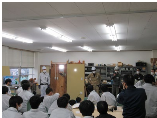
令和3年12月16日（木） 新潟工業高校 電気科 2年生 58人