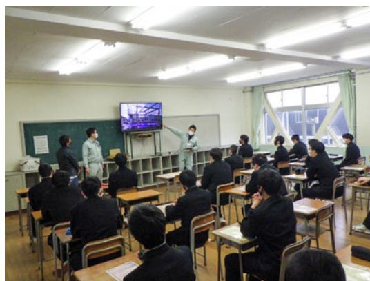
令和4年3月14日(月) 新潟県央工業高校 情報電子科 生産プログラミングコース 2年生 25人